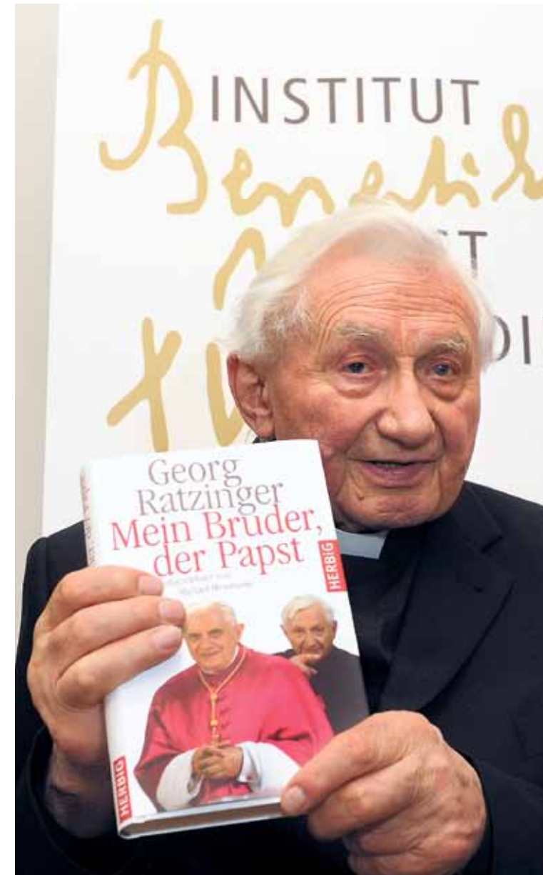
Bratr. Georg Ratzinger představuje 11. září 2011 v jihoněmeckém Regensburgu knihu Mein Bruder, der Papst.